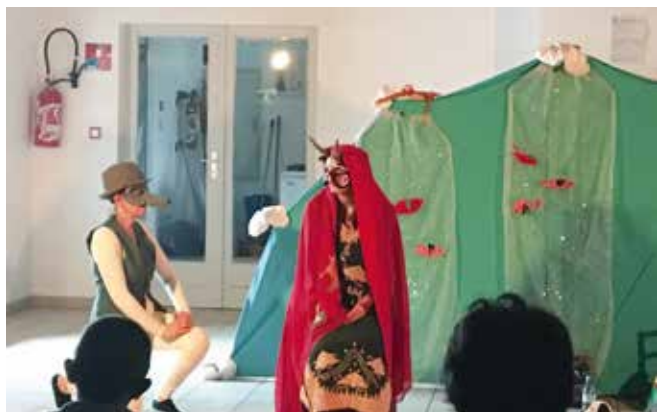
Les élèves de CM1 – CM2.