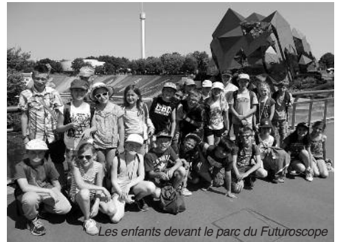
Les enfants devant le parc du Futuroscope