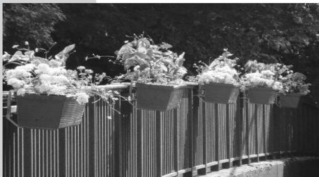
Un début d'embellissement de nos entrées