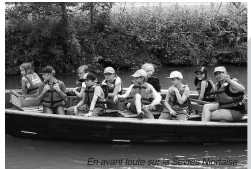
En avant toute sur la Sèvres Niortaise