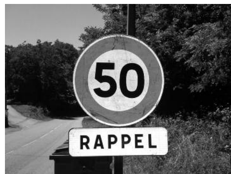
Pour votre sécurité