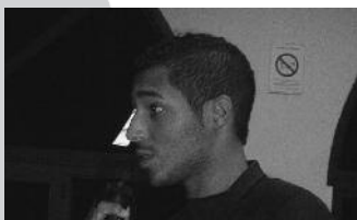
"LE BERCEAU" par Lucca Michel