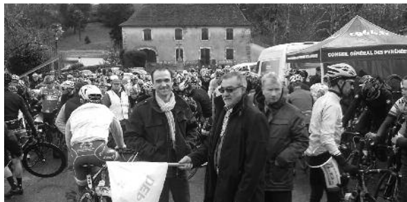
Le départ de l'ESSOR BASQUE