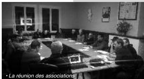
• La réunion des associations