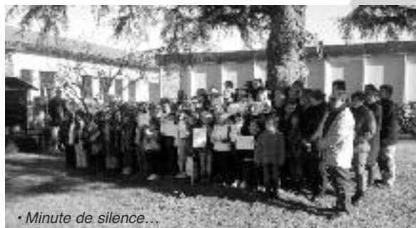
• Minute de silence...