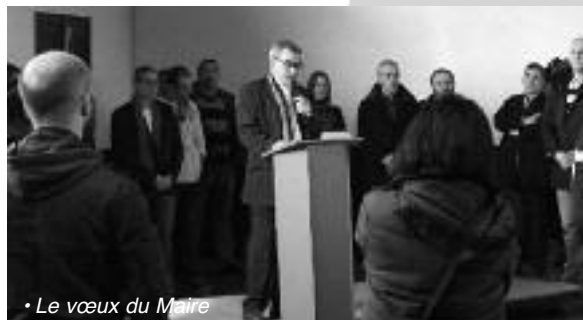
• Le vœux du Maire